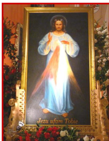
Obraz Jezusa Miłosiernego

Uczniowie dowiedzieli się wielu ciekawych rzeczy z życia św. Faustyny.