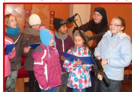
na zdjęciu nasi uczniowie- śpiewająca schola